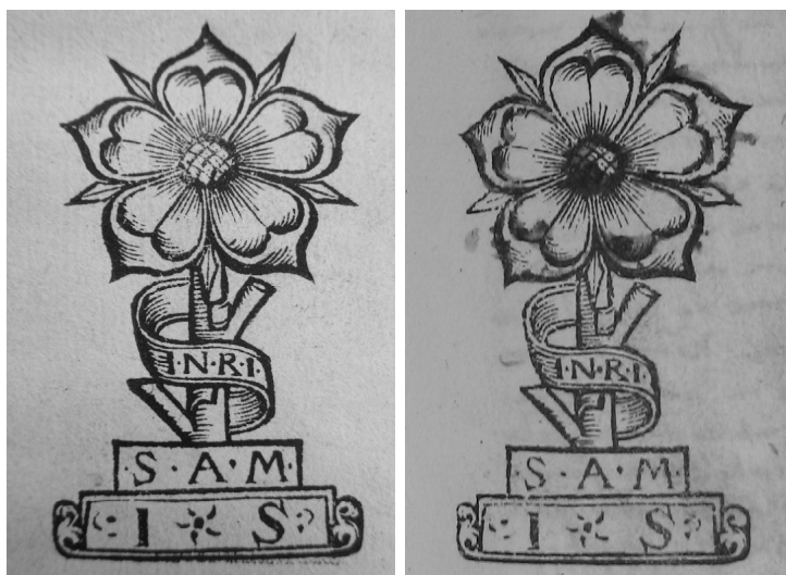
Il. 1. Po lewej: odbitka klocka drzeworytniczego ze znakiem notarialnym J. Żdżarowskiego, użytym w funkcji ekslibrisu (Gniezno, AAG, BK Inc. 37, k. nlb 1b); po prawej: odbitka tegoż znaku przy wpisie admisyjnym (Kraków, AKMK, AOff. 37, s. 665)