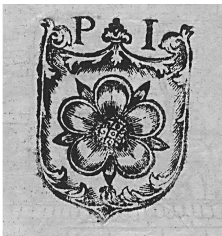
Il. 2. Ekslibris Piotra Izdbieńskiego (Johannes Chrysostomus, Index in Quinque Tomos operum... , Basel: A. Cratander, 1522, 2 o , Poznań, Biblioteka PTPN, sygn. 47941, T. 3, k. tyt. verso)

Żdżarowskiego wykazują pewne podobieństwa do wykończeń boków italianizującej tarczy herbowej z księgoznaku Izdbieńskiego. Sądzę, że obydwie klocki drzewo-