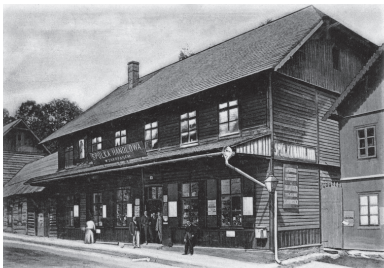
10. Budynek Spółki Handlowej w Zakopanem, koniec XIX w.