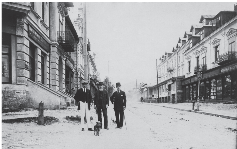
11. Ulica Krupówki, około 1910