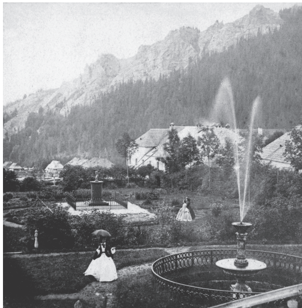
9. Ogród dworski i budynek dyrekcji huty w Zakopanem, 1859

gontem, a przede wszystkim liczne ganki, wykusze, werandy i balkony, a więc elementy z architektury historycznej i budownictwa ludowego różnych regionów. Całość zdobiła bogata dekoracja z wyrzynanych desek. Pod wpływem tej architektury w chałupach górskich pojawiły się ganki, werandy i balustrady z ażurowo wycinanych desek, ale jej zasadniczy kształt i konstrukcja nie uległy zmianie.