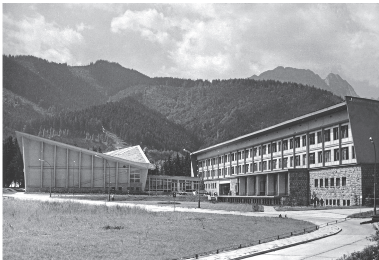
14. Zakopane — Ośrodek Przygotowań Olimpijskich, 1962

(1962–1965, proj. A. Górską), Kolejarz przy ul. Kościuszki (1963–1965, proj. K. i J. Dobrowolscy), Halny przy ul. Kościuszki (1964, proj. Adam Fołtyn), Panorama przy ul. Wierchowej (1965, proj. J. Dajewski), Hynny przy ul. 15. Grudnia (dzisiaj ul. Piłsudskiego — 1966–1970, proj. Z. Miecznikowski, S. Miroszowski, T. Suwaj; proj. wewnątrz I. Zaleśna).