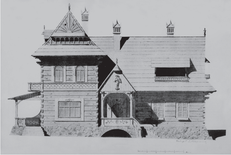
12. Willa Koliba w stylu zakopiańskim, proj. S. Witkiewicz, 1892