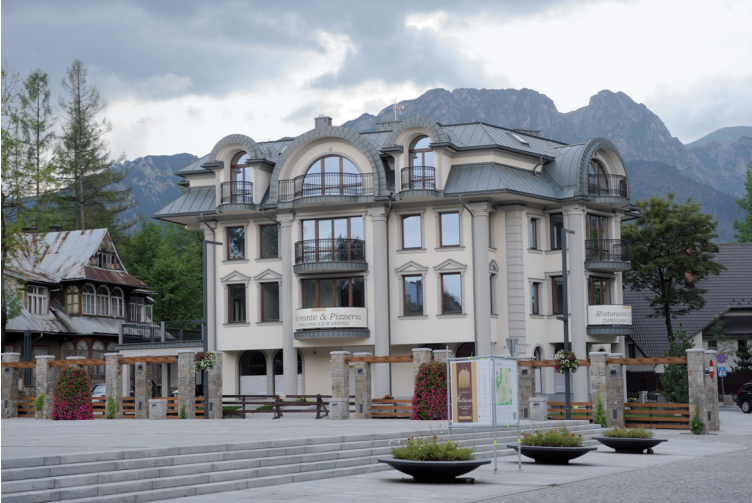
15. Zakopane — budynek mieszkalno-usługowy w miejscu drukarni Polonia, 2015