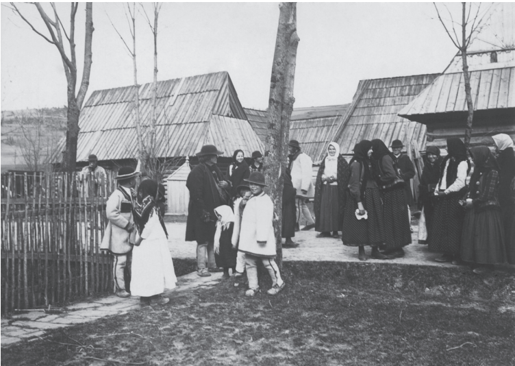
8. Ulica Kościeliska w Zakopanem, koniec XIX w.

wont, podstawowym typem zabudowy były zagrody jednobudynkowe (chałupa jednoizbowa z sienią oraz stajnia), które pod koniec XVIII w., a powszechniej