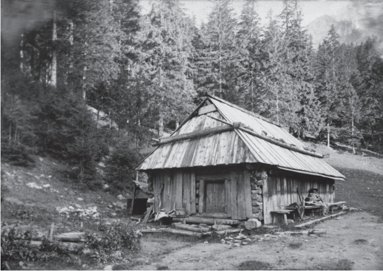
7. Szałas w Dolinie Strążyskiej, koniec XIX w.