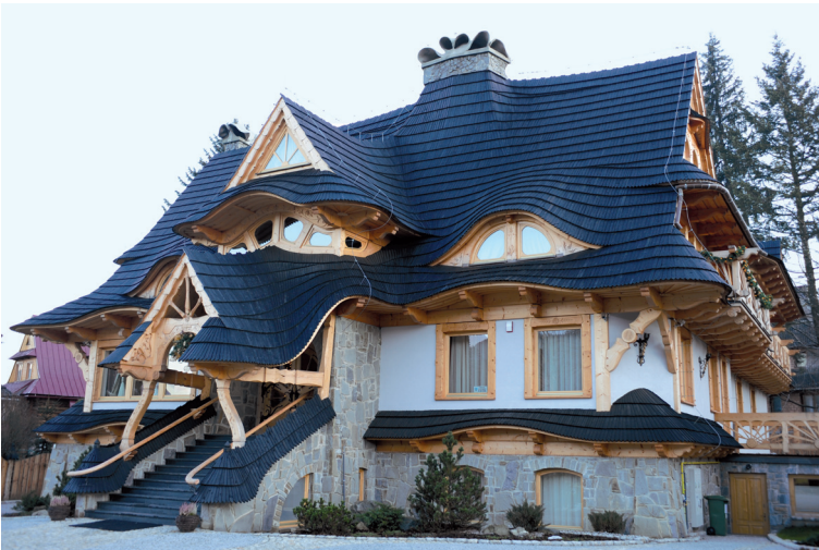
16. Zakopane — architektura współczesna

na Pardałowce (2006–2007, proj. Piotr Leja), hotel Crocus przy ul. Chałubińskiego 40 (2006–2008, proj. A. i R. Rafacz), apartamenty Kaszelewskiego przy ul. Kaszelewskiego 7c (2007–2008, proj. A. i R. Rafacz), apartamenty Olczyńska przy ul. Wojdyły 13 (2007–2008, proj. A. i R. Rafacz), apartamenty Oaza przy ul. Grunwaldzkiej (2008–2009, proj. K. Kiełb), hotel Grand „Nosalowy Dwór” przy ul. O. Balzera 21d (2008–2009, proj. A. i R. Rafacz), hotel Sobiechowska na Sobiechowskiej-Bór (2008–2009, proj. A. i R. Rafacz), budynek mieszkalny przy ul. Jagiellońskiej 33 (2009, proj. S. Topór), budynek handlowy H&M przy ul. Krupówki (2009–2010, proj. Teresa Trojan-Korn, Paweł Szlachetowski, Szymon Szat-