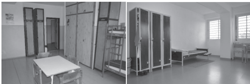
Fot. 1a. Cella mieszkalna — stan pierwotny Fot. 1b. Cella mieszkalna po przebudowie

Fotodokumentacja (fot. 1a–d) oddziału wyjściowego w Zakładzie Karnym w Hrnčiarovcach nad Parnou przedstawia porównanie pomieszczeń mieszkalnych w stanie przed i po przebudowie oraz stworzeniu oddziału wyjściowego.