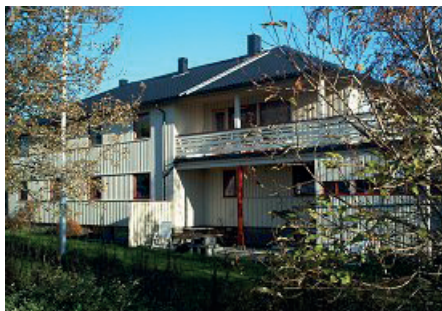
Fot. 4. Dom przejściowy w Bodø