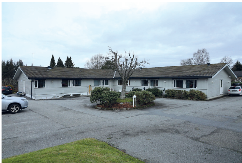
Fot. 2. Dom przejściowy w Auklend