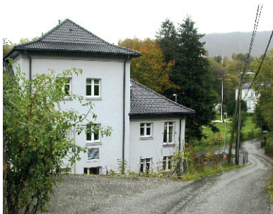
Fot. 7. Dom przejściowy w Lyderhorn