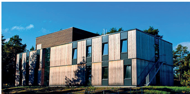
Fot. 1. Dom przejściowy w Halden