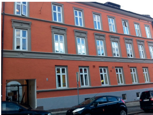
Fot. 8. Dom przejściowy w Oslo