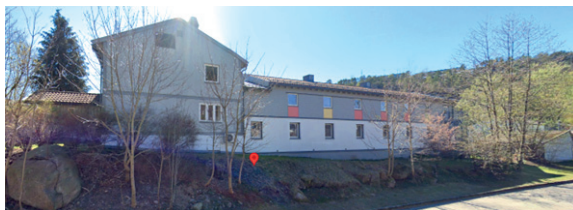
Fot. 5. Dom przejściowy w Solholmen