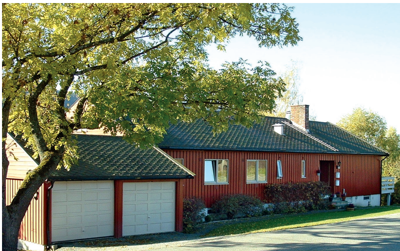
Fot. 3. Dom przejściowy w Buskerud