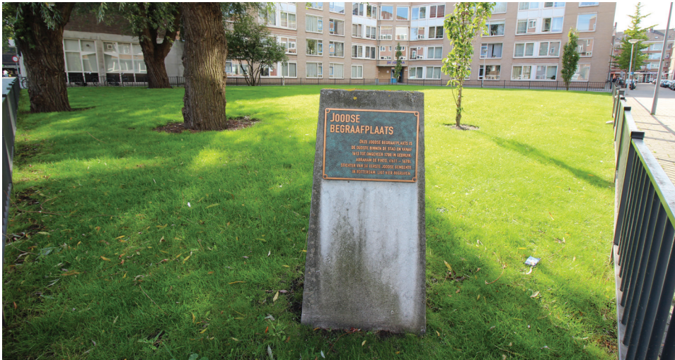
Afbeelding 2. De begraafplaats Beis Hakkeworous; foto's overgenomen van URL < https://commons.wikimedia.org/wiki/File:Joodse_begraafplaats_Jan_van_Loonslaan_1.jpg > (CC BY-SA 4.0)