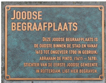
Afbeelding 1. Het bordje bij de Joods begraafplaats Beis Hakkeworous