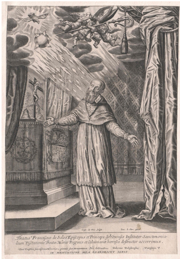
12. Beatus Franciscus de Sales, XVII w., miedzioryt.

Beatus Franciscus de Sales, 17th c., copperplate.