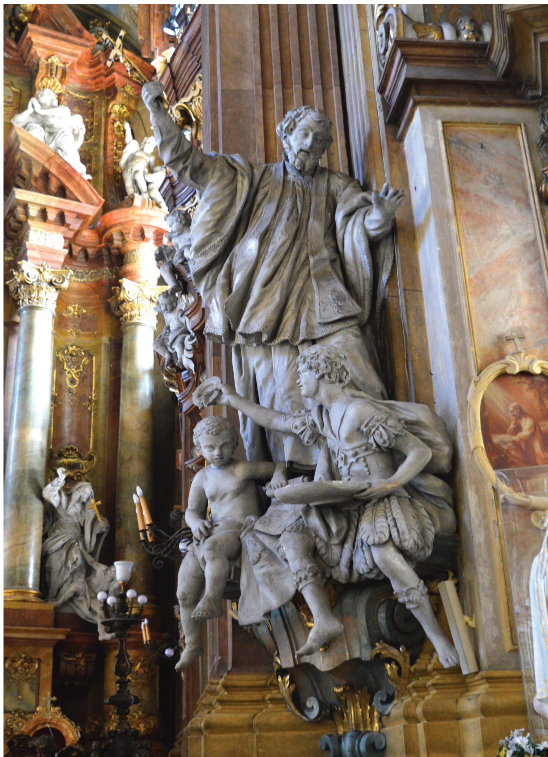
17. Johann Albrecht Siegwitz, grupa rzeźbiarska ze św. Franciszkiem Ksawerym, 1726, stiuk; kościół pw. Najświętszego Imienia Jezus.

Johann Albrecht Siegwitz, sculptural group with St. Francis Xavier, 1726, stucco; Church of the Most Sacred Name of Jesus.