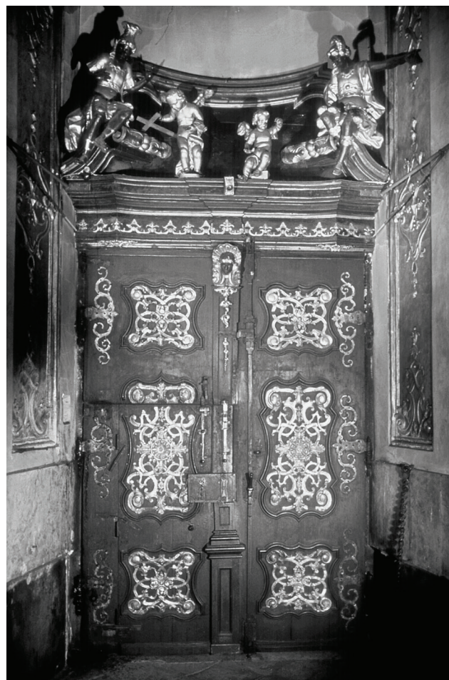
6. Kościół pw. Najświętszego Imienia Jezus, kaplica św. Franciszka Ksawerego, widok portalu. Fot. R. Jagusch, Instytut Herdera w Marburgu, 1944, nr inv. 46731

Church of the Most Sacred Name of Jesus, Chapel of St. Francis Xavier, the view of the western wall with the confessional. Photo from: G. Grundmann, Barockfresken in Breslau , Frankfurt am Main 1967, p. 133, Fig. 33