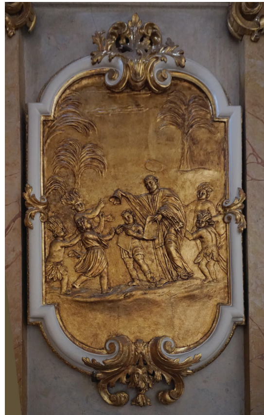
7. a-b) Christoph Tausch, sceny nauczania przez św. Franciszka Ksawerego, ok. 1715, drewno złotone; Wiedeń, kościół św. Anny, dawna kaplica św. Franciszka Ksawerego.

a-b) Christoph Tausch, preaching scenes by St. Francis Xavier, ca. 1715, gilded wood; Vienna, St. Anne's Church, Former Chapel of St. Francis Xavier.