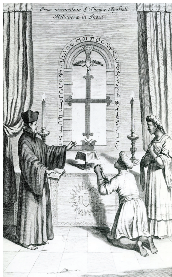
11. Relikwiarz św. Tomasza w Meliapore, XVIII w., miedzioryt.

W omawianej dekoracji pojawia się też drugi wątek – chrystologiczny, odnoszący się do umiłowania Ukrzyżowanego, jak również do chęci naśladowania Chrystusa i szczególnie-