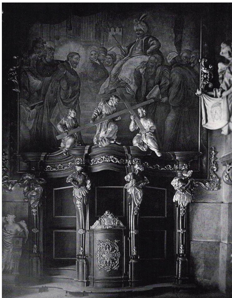
5. Kościół pw. Najświętszego Imienia Jezus, kaplica św. Franciszka Ksawerego, ściana zachodnia z konfesjonalem.

Church of the Most Sacred Name of Jesus, Chapel of St. Francis Xavier, the view of the western wall with the confessional.