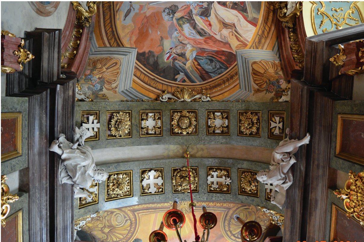
15. Kościół pw. Najświętszego Imienia Jezus, kaplica św. Franciszka Ksawerego, widok gurtów sklepiennych. Church of the Most Sacred Name of Jesus, Chapel of St. Francis Xavier, vault view with transverse arches.

i poparcie. Krzyż św. Tomasza Apostoła odsyła do początków krzewienia chrześcijaństwa i do działalności misyjnej na terenach Indii. Krzyż owinięty winną latoroślą wiąże się z jezuitką czią oddawaną Krwi i Męce Chrystusa. W dekoracji pojawia się też krzyż morowy ( karawaka , zwany również cholerycznym), popularny w XVII i XVIII w., a pochodzący z Hiszpanii 65 . Sens tego ostatniego łączy się z cudownym ocaleniem uczestników soboru trydenckiego przed zarazą w r. 1574. Te dwa wątki wprost odnoszą się do omawianej kaplicy, eksponując znacznie wspomnianego soboru i będącej jego wynikiem odnowy Kościoła stojącego do walki z protestantami 66 . Jednocześnie widzieć tu można nawiązanie do św. Franciszka Ksawerego jako patrona strzegącego przed zarazą. Dekoracji tej towarzyszy siedzący na gzymsie anioł, który również dzierży w dłoni krucyfiks.