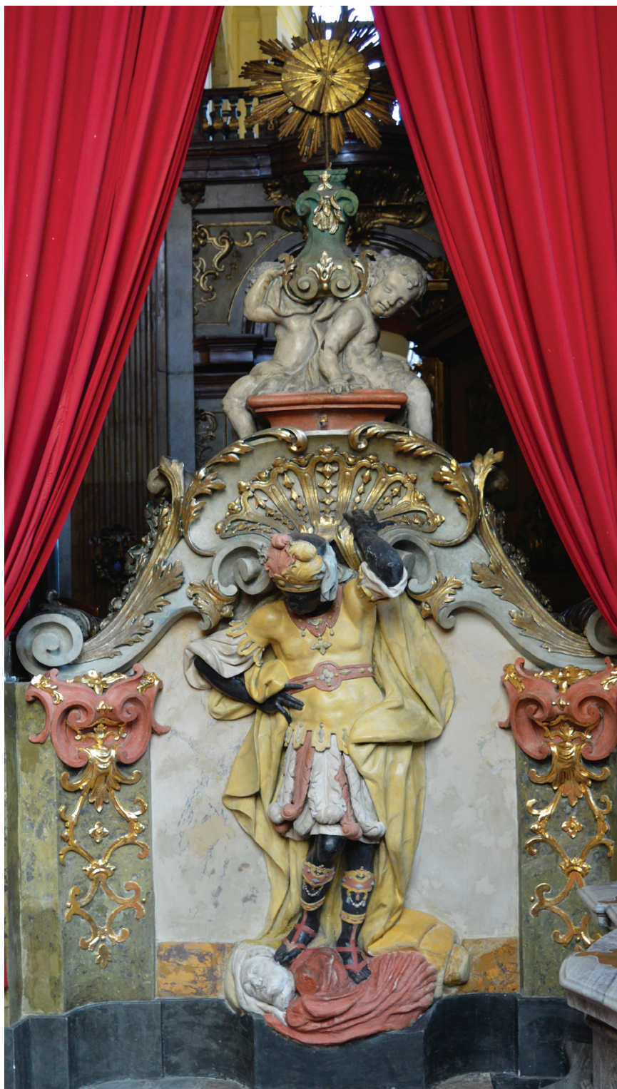
3. Kościół pw. Najświętszego Imienia Jezus, kaplica św. Franciszka Ksawerego, postument z atlantem o negroidalnych rysach, ok. 1730, stiuk.

Church of the Most Sacred Name of Jesus, Chapel of St. Francis Xavier, a pedestal with an atlant with negroid features, ca. 1730, stucco.