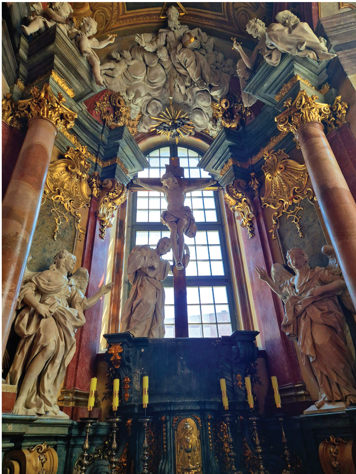
2. Kościół pw. Najświętszego Imienia Jezus, kaplica św. Franciszka Ksawerego, widok ołtarza.

Church of the Most Sacred Name of Jesus, Chapel of St. Francis Xavier, altar view.