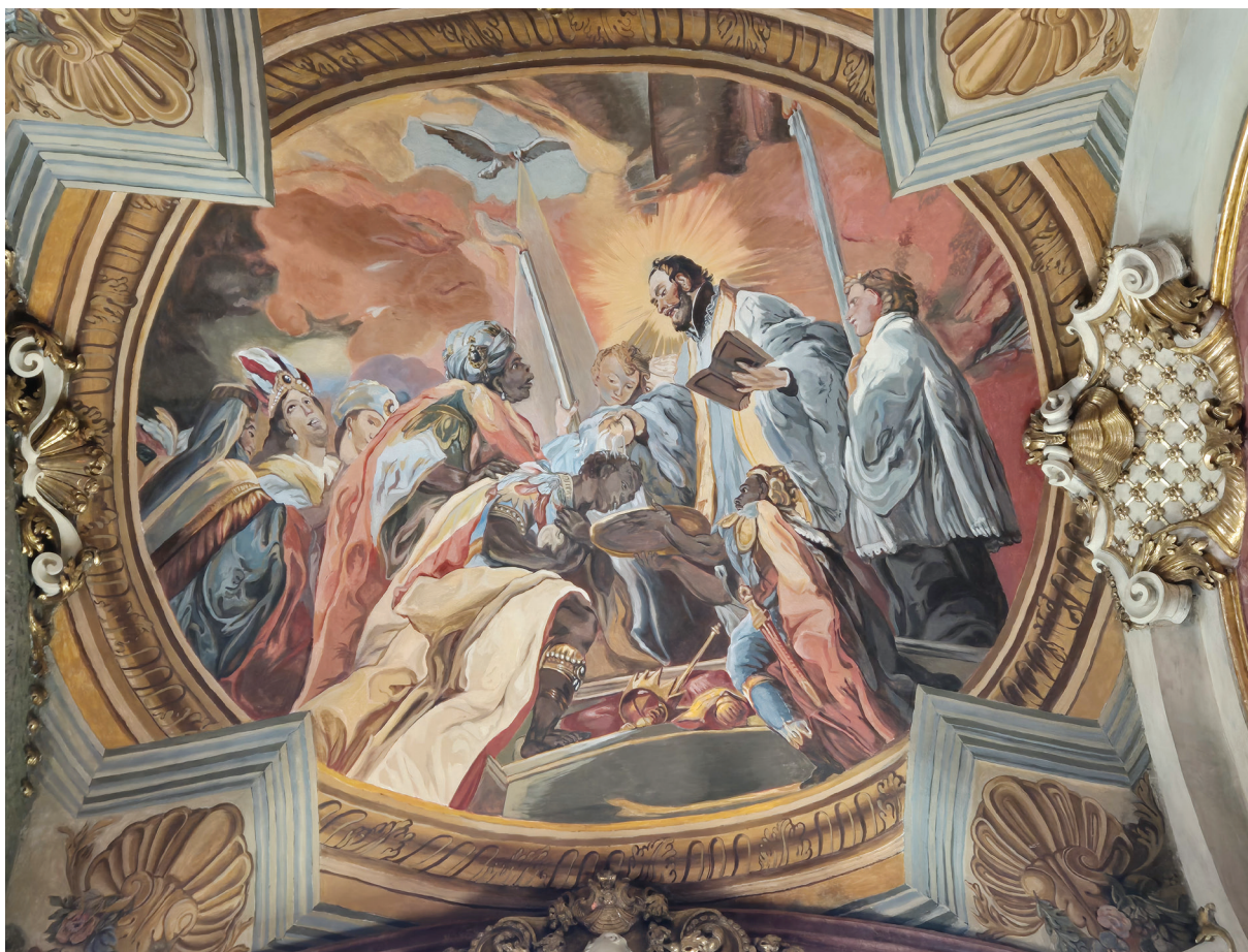
10. Johann Michael Rottmayr, scena chrztu udzielanego przez św. Franciszka Ksawerego, 1703–1706, fresk; kościół pw. Najświętszego Imienia Jezus, kaplica św. Franciszka Ksawerego po pracach konserwatorskich.

Johann Michael Rottmayr, scene of baptism by St. Francis Xavier, 1703–1706, fresco; Church of the Most Sacred Name of Jesus, Chapel of St. Francis Xavier after conservation works.