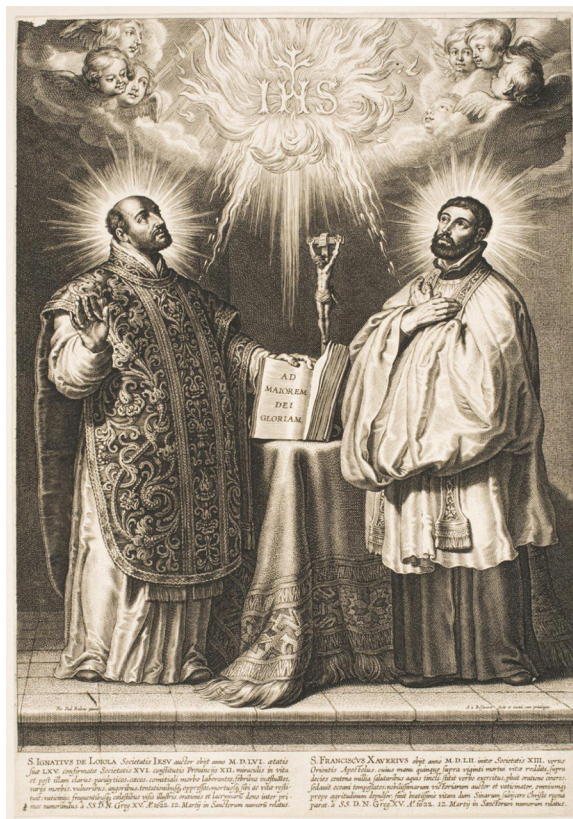
13. Schelte Adams Bolswert według Petera Paula Rubensa, Św. Ignacy Loyola i św. Franciszek Ksawery, druga połowa XVII w., miedzioryt; Philadelphia Museum of Art.

12 marca 1622 papież Grzegorz XV dokonał pierwszej zbiorowej kanonizacji, wynosząc na ołtarze Hiszpanów, w tym założycieli zakonu jezuitów – Franciszka Ksawerego i Ignacego Loyolę, a także mistyczkę Teresę z Ávila oraz Izydora Oracza. Kanonizowano z nimi również włoskiego zakonnik Filipa Nereusza, który notabene za przykładem św. Franciszka Ksawere-