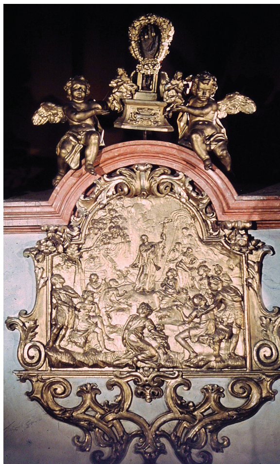
4. Kościół pw. Najświętszego Imienia Jezus, kaplica św. Franciszka Ksawerego, płaskorzeźba ze sceną nauczania przez św. Franciszka Ksawerego oraz relikwiarz z partykułami św. Franciszka Ksawerego. Fot. R. Jagusch, Instytut Herdera w Marburgu, 1944, nr inw. 46749

Vis-à-vis ołtarza usytuowany był konfesjonał z grupą rzeźbiarską trzech jezuitów, wśród których pośrodku znajdował się św. Franciszek Ksawery dźwigający krzyż (niezachowany [il. 5]). Konfesjonał ów pierwotnie artykułowany był hermowymi atlantami o fizjonomii mieszkańców Afryki. Po bokach flankowały go,