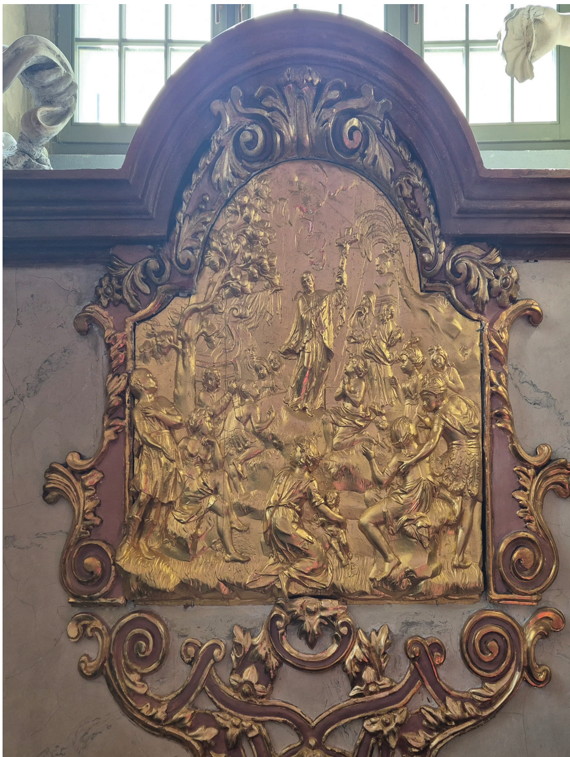
7 c) Franz Joseph Mangoldt (?), scena nauczania przez św. Franciszka Ksawerego, ok. 1730, drewno złotone; kościół pw. Najświętszego Imienia Jezus, kaplica św. Franciszka Ksawerego.

c) Franz Joseph Mangoldt (?), preaching scene by St. Francis Xavier, ca. 1730, gilded wood; Church of the Most Sacred Name of Jesus, Chapel of St. Francis Xavier.