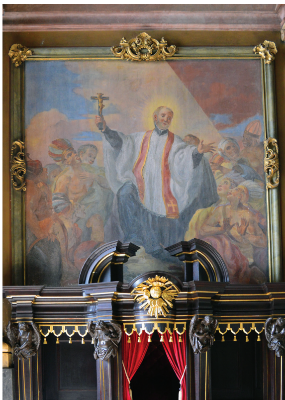
16. Johann Michael Rottmayr, scena ze św. Franciszkiem Ksawerym głoszącym kazanie, 1703–1706, fresk; kościół pw. Najświętszego Imienia Jezus.

Johann Michael Rottmayr, scene with St. Francis Xavier preaching, 1703–1706, fresco; Church of the Most Sacred Name of Jesus.