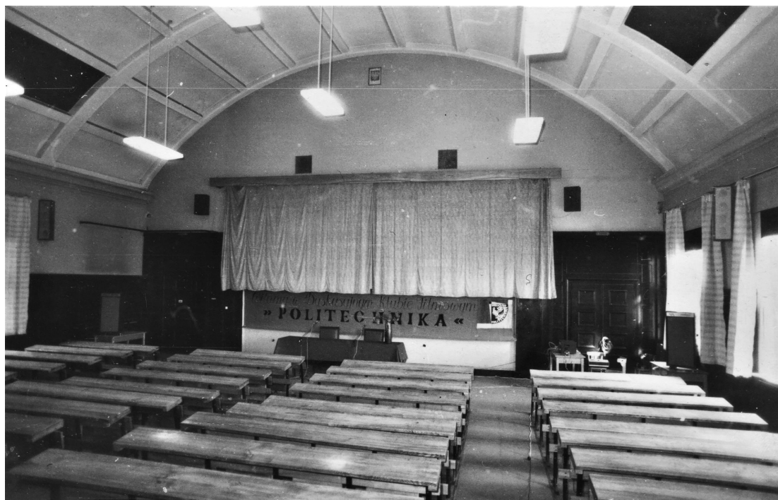
2. Sala 329 w budynku A-1, miejsce spotkań wszystkich pokoleń członków DKF „Politechnika”, zdjęcie z lat siedemdziesiątych.

że choć liczba aktywnych członków klubu pozostaje zmienna, to utrzymuje się w okolicach setki osób, a sama inicjatywa zdobywa coraz większą popularność. Reakcja następuje bardzo szybko, 8 stycznia 1967 roku DKF „Politechnika” otrzymuje w Federacji pożądaną staż stały 15 . Można przyjąć, że kończy to pierwszy etap funkcjonowania klubu. Do 1967 roku ukonstytuowała się podstawowa forma jego działania, załatwiono formalności związane z członkostwem w Federacji i współpracą z Politechniką Wrocławską oraz ZMS. Te fundamenty nie zmieniły się nadmiernie przez kolejne lata, więc już teraz możemy przyjrzeć się im bliżej.