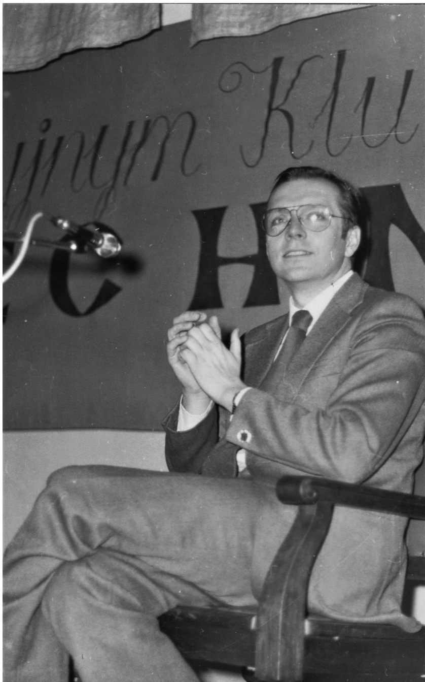
3. Krzysztof Zanussi w sali DKF „Politechnika”, 8.04.1979.