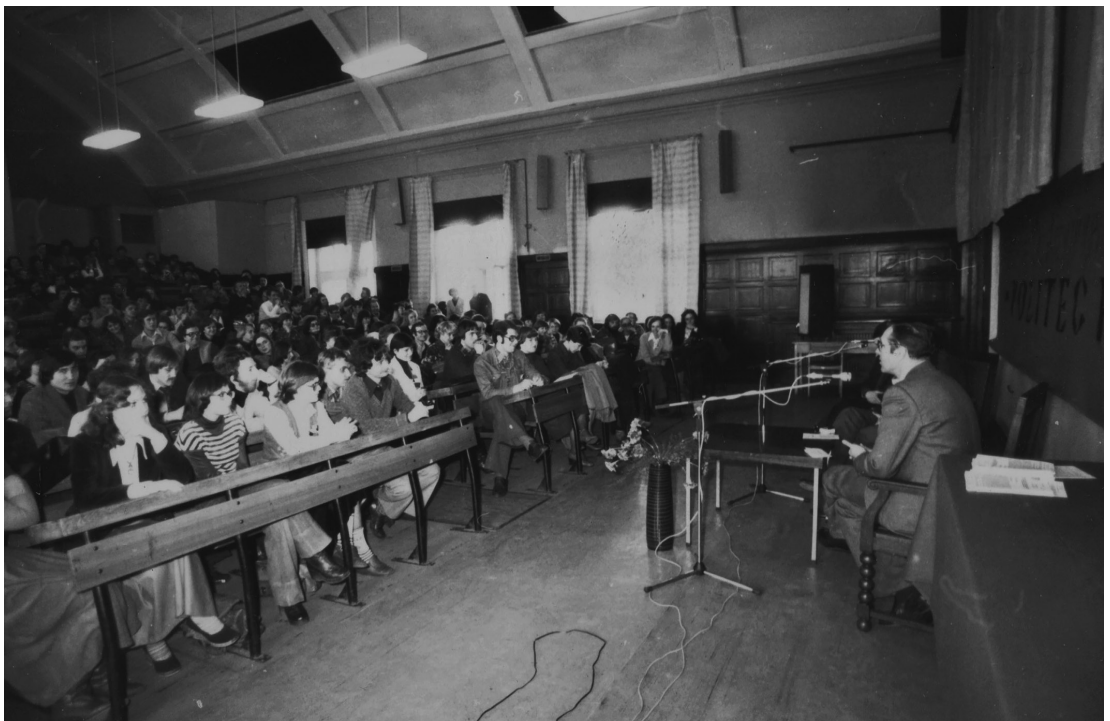
4. Sala DKF „Politechnika” podczas forum dyskusyjnego z Krzysztofem Zanussim, 8.04.1979.