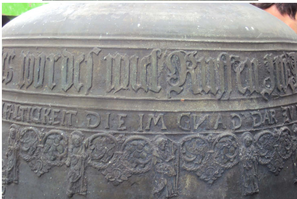
Fot. 7a–7b. Motywy dekoracyjne i inskrypcje na dzwonie z Konotopu, fot. M. Poźniak 2021 r.