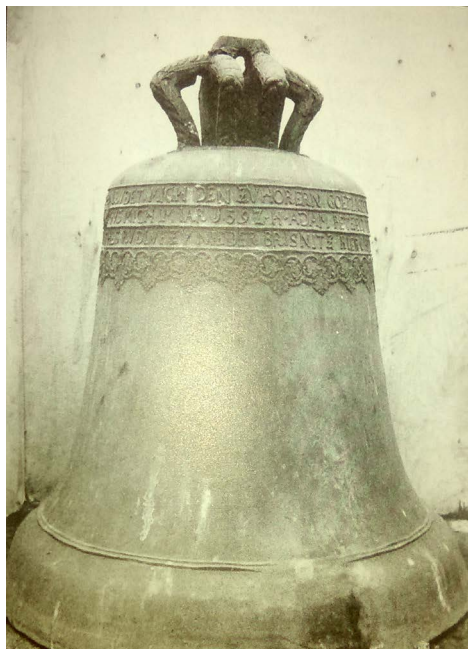
Fot. 3. Dzwon z Brzeźnicy.