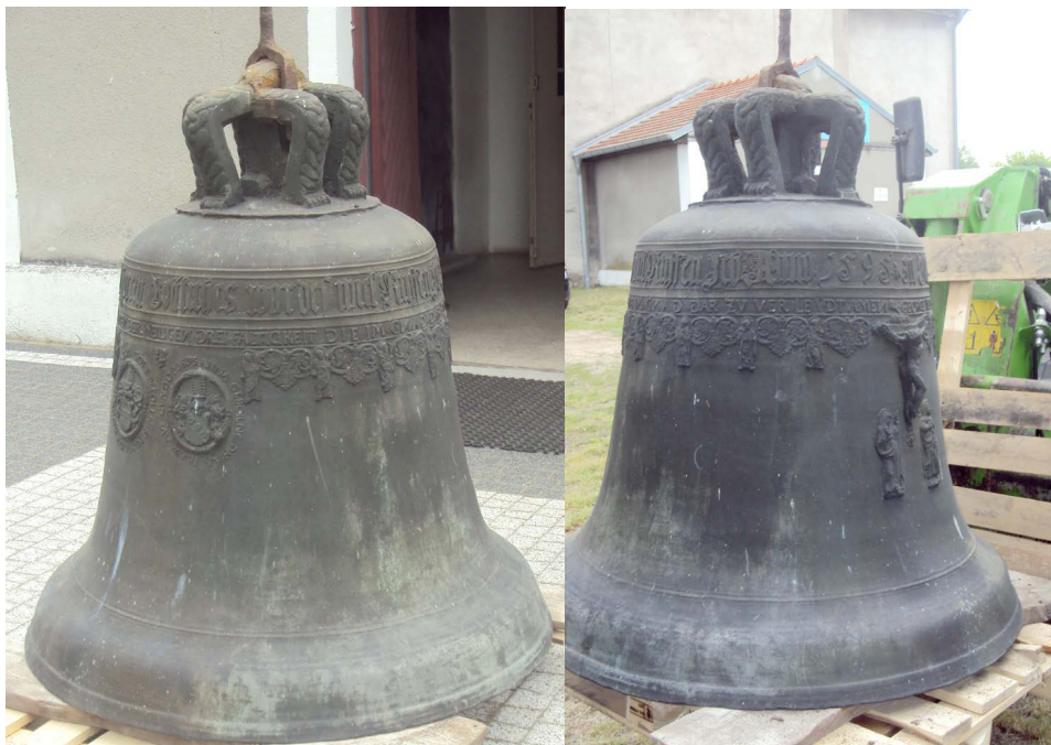
Fot. 6a–6b. Dzwon z Konotopu, fot. M. Poźniak, 2021 r.