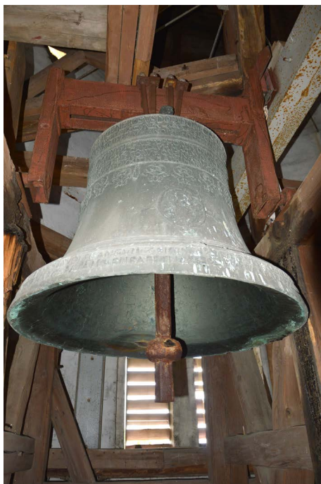
Fot. 9. Dzwon z Konina Żagańskiego, fot. M. Poźniak, M. Tureczek, 2021 r.