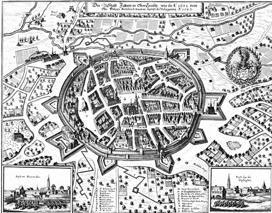
Fot. 1. Żytawa w połowie XVII wieku.