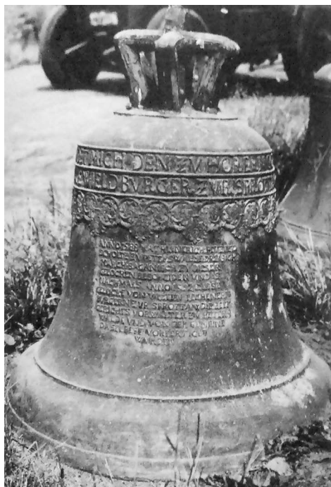
Fot. 4. Dzwon ze Skibic (1). Źródło: M. Tureczek, Leihglocken , s. 571.