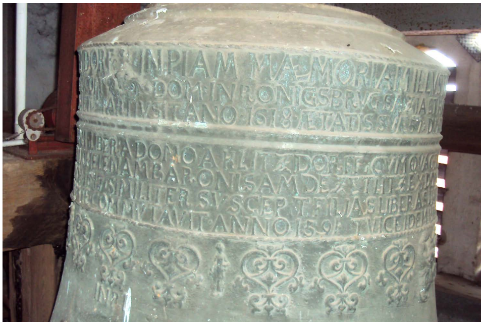
Fot. 10. Motywy dekoracyjne i inskrypcje na dzwone z Konina Żagańskiego, fot. M. Poźniak, M. Tureczek, 2021 r.