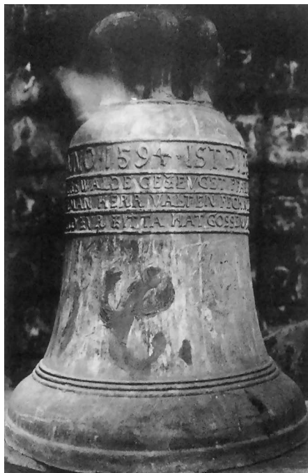
Fot. 5. Dzwon ze Skibic (2). Źródło: M. Tureczek, Leihglocken, s. 573.