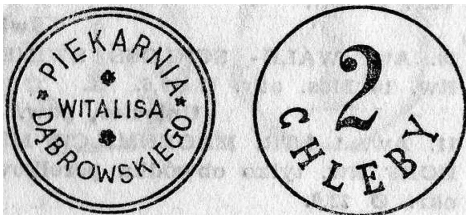
Il. 4. Żeton deputatowy piekarni Witalisa Dąbrowskiego o wartości „2 chlebów” (awers i rewers). Źródło: Władysław R. Pustułka, O monetach zastępczych z Zagłębia Dąbrowskiego , „Biuletyn Numizmatyczny”, 1986, 5–8, s. 145.

Obydwa żetony posiadają w zasadzie identyczne wizerunki, prezentując po stronie awersu napis „PIEKARNIA WITALISA DĄBROWSKIEGO”, przedzielony sześć- i pięciopłatkowymi kwiatami, a na rewersie nominał. Wykonane w mosiądzu numizmaty różnią się średnicą – niższy nominał ma według katalogów 21 mm 12 , a wyższy 22 mm. Znane są także dane wagowe odnoszące się do nominału „1 chleb” i wahają się one w przedziale 4,00–4,21 g 13 .