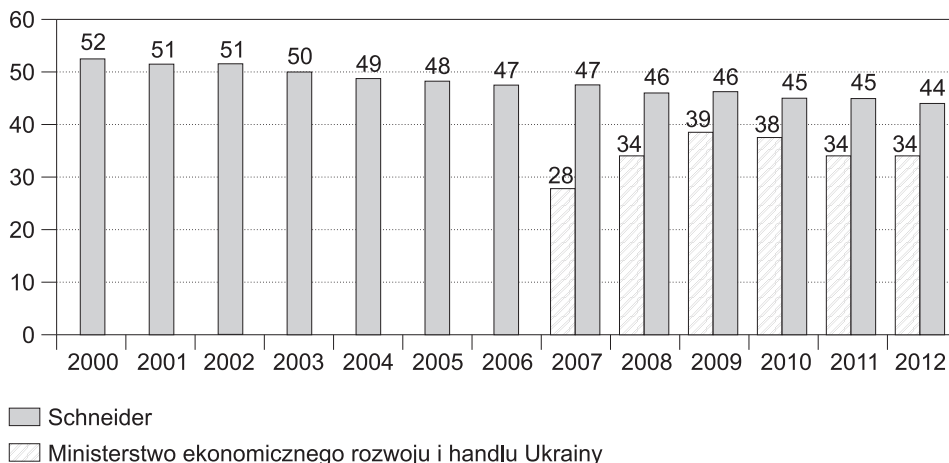
Rysunek 1. Poziom szarej strefy w gospodarce Ukrainy (jako procent od PKB)